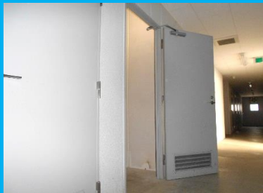
収納庫の入口はドア (ドアの幅は約80cmです)