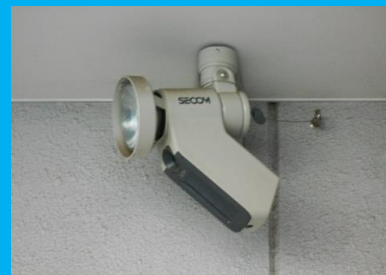
建物入口防犯カメラ