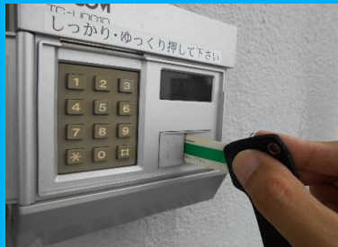
建物入口セキュリティ (夜24時~朝6時は入館不可)