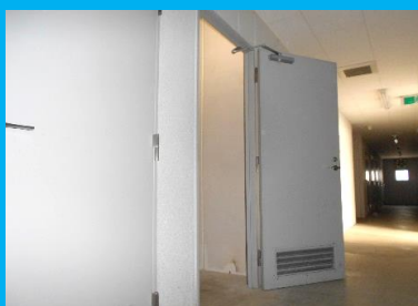
収納庫の入口はドア (ドアの幅は約80cmです)