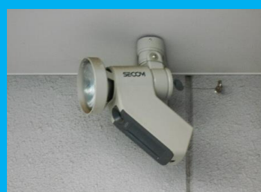
建物入口防犯カメラ