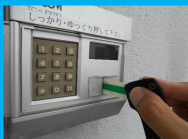
建物入口セキュリティ (夜24時~朝6時は入館不可)