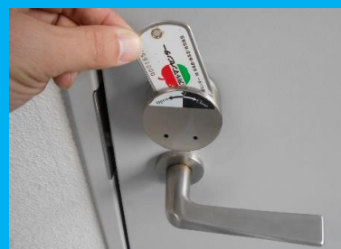
収納庫はカードキー採用