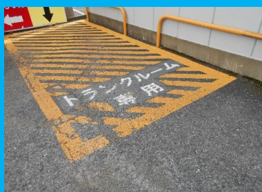
搬入出時の駐車場(1台分) ※併設するコインパーキングは当社の 管理ではございません。